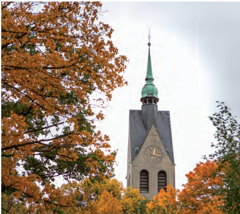
evangelische Friedenskirche Wildau