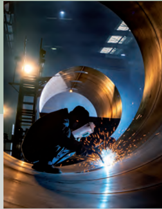
Imme Metallbau Frank Imme

Potsdamer Str. 19 15738 Zeuthen Tel./Fax 030 – 859 743 14 Mobil 0173/ 959 908 0 Mail polak-bautenschutz@web.de