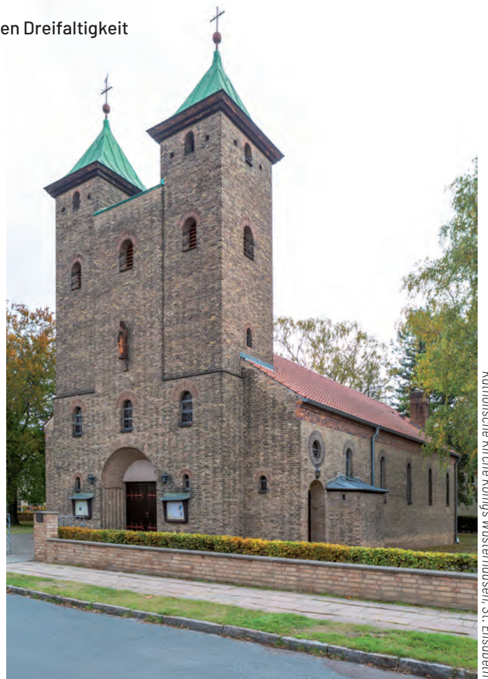
Katholische Kirche Königs Wusterhausen, St. Elisabeth

27.08. So – Messzeiten getauscht: 09.00 Uhr Königs Wusterhausen und 10.30 Uhr Eichwalde